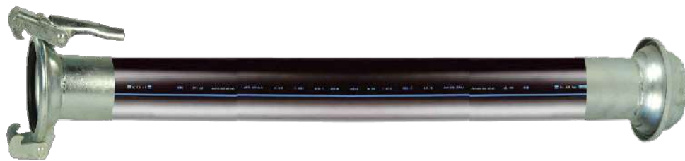
tipo: SFERICO Ferrari