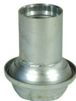
tipo: SFERICO Ferrari